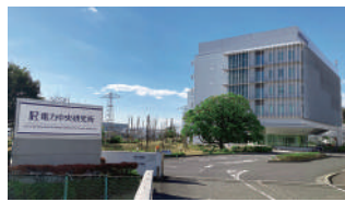
一般財団法人 電力中央研究所