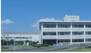
日産自動車株式会社 追浜工場