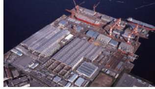
住友重機械工業株式会社 横須賀製造所