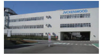
株式会社JVCケンウッド 横須賀事業所