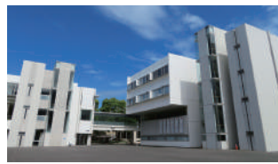
学校法人 神奈川歯科大学