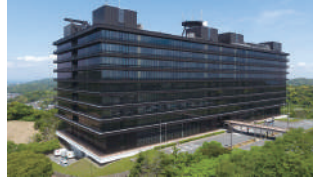
日本電信電話株式会社 横須賀研究開発センター