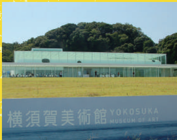
横須賀美術館 YOKOSUKA MUSEUM OF ART