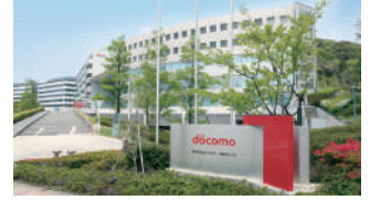
株式会社NTTドコモ ドコモR&Dセンター