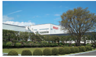
株式会社オカムラ 追浜事業所