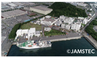
国立研究開発法人 海洋研究開発機構 (JAMSTEC)